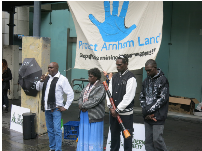
Sydney Protest – 19 Juli 2013

Mehr Info: http://www.respectandlisten.org/arnhem-land/protect-arnhem-land.html